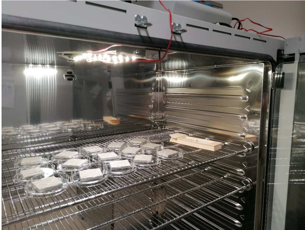
Abb. 3: Inkubation mit LED-Licht Beleuchtung / incubation with LED-light illumination