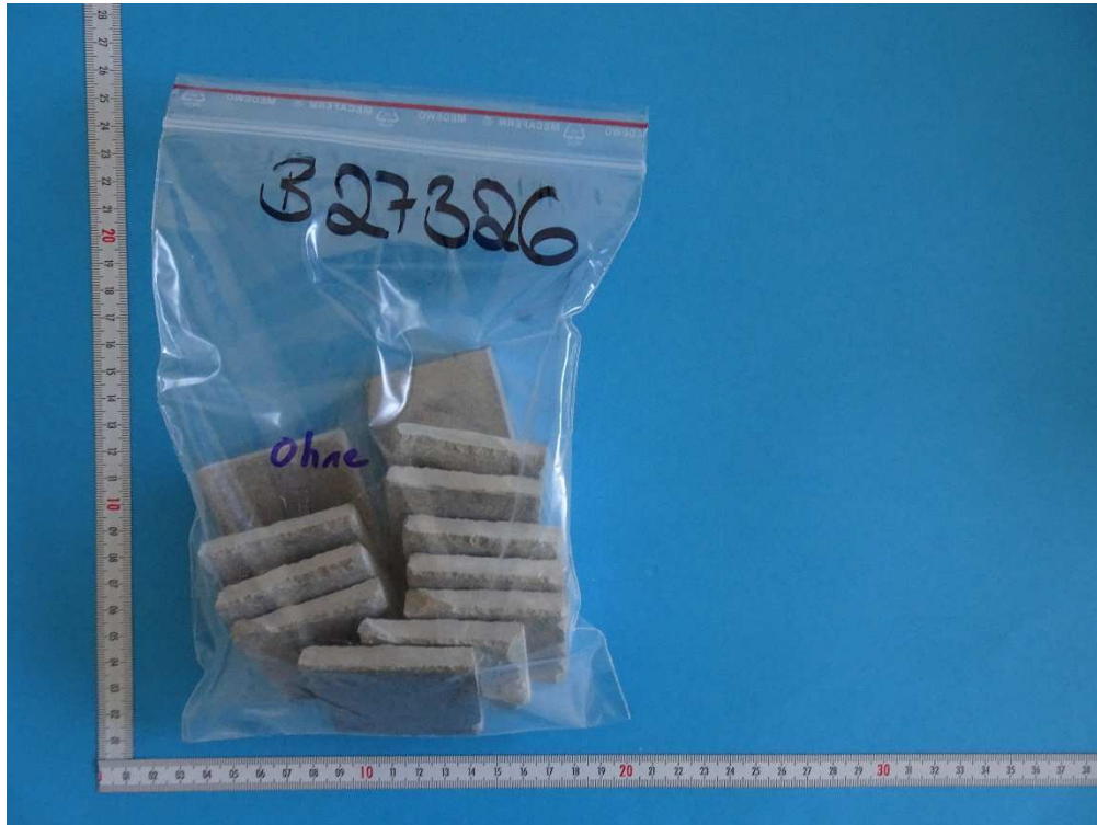
Abb. 1: Betonfläche / concrete surface