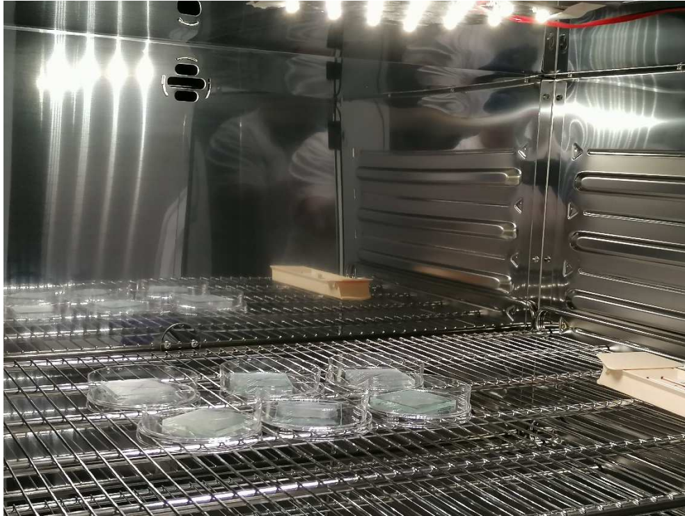
Abb. 3: Inkubation mit LED-Licht Beleuchtung / incubation with LED-light illumination